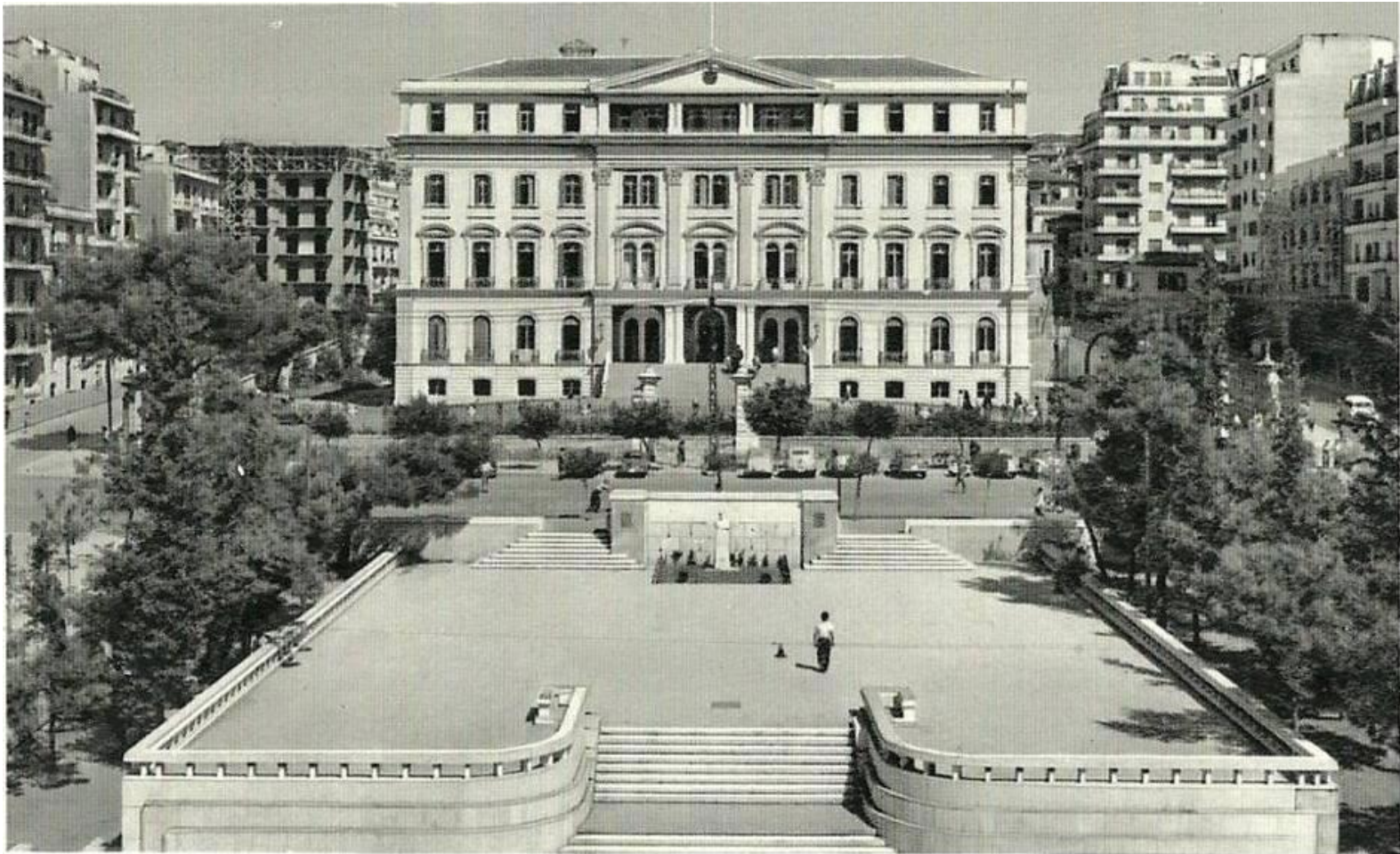
Δ-491 ΘΕΣΣΑΛΟΝΙΚΗ. Τὸ Διοικητήριον