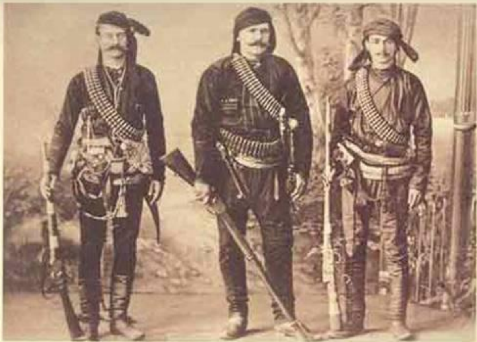
ΤΡΑΠΕΖΟΥΝΤΑ ΕΝΔΡΜΑΣΙΑ ΚΑΣΩΝ 1897