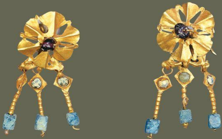
Ζεύγος χρυσών ενωτίων με σμαραγδόπετρα και γρανάτη.