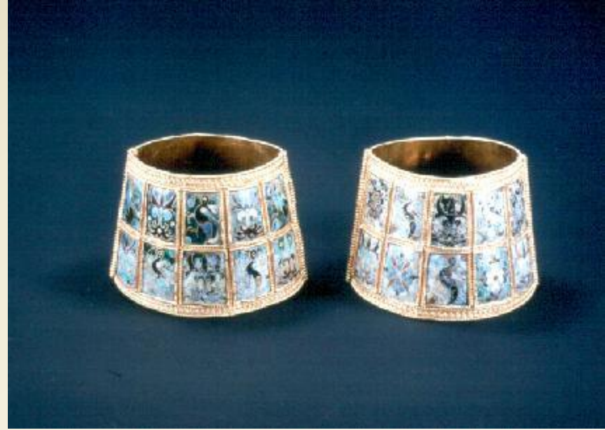
Χρυσά περικάρπια με διάκοσμο από σμάλτο, 9ος-11ος αι.