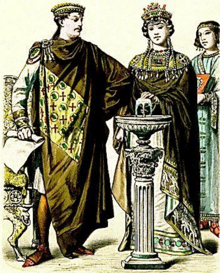
Καίσαρ Justinian. (482—565.)