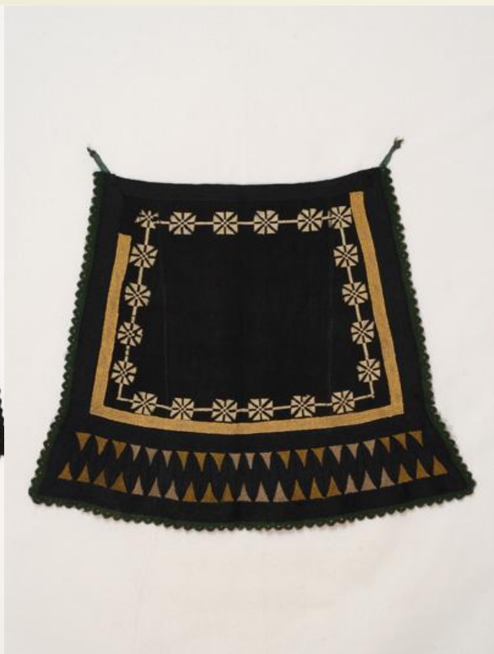
Παναούλα ( Σαρακατσάνικη Ποδιά).